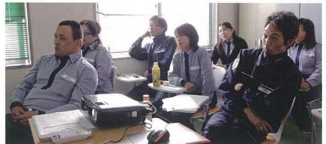
写真3 3か月に1回、社員に休日出勤してもらい開催される安全大会

現実を直視し、SRによる“運転の見える化”に踏み切りました。月初、ドライバーが目標点数を宣言し、その結果を社内に一覧として掲出し、月平均最高得点者を表彰しました(図)。導入後、半年間にわたり、診断項目ごとに平均得点の推移や、燃費改善効果をグラフで掲出して、 弱点や課題を見える化 することで、SR運用の意義と向上心につなげました。SRで安全教育指導も改善。月1の管理者安全会議では、SRデータを精査して急な操作を行うドライバーの撲滅を図るため、安全講習会を実施。クイズ形式で楽しくKYTを行ったり、重大課題克服キャンペーンなども行っています(写真3、4)。 今後は 車両・荷物事故ゼロを100日から200日達成 へと高く掲げ、ドライバーが輸送の安全を追求するプロとして誇りを持ち、地域貢献できる会社を目指します。