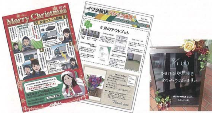
写真1 きめ細やかなおもてなしでの接客が話題になり、NHKなどのメディアでも紹介された。左からクリスマスカードとニュースレター、来客時のウエルカムボード