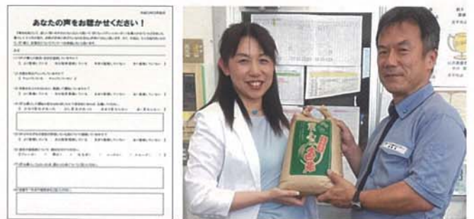
写真4 アンケートで現場ドライバーの声を聞き、「やらされ感」やマンネリ化をなくす(左)。5つのSR診断項目のうち「ブレーキ」と「ハンドル」での得点アップが見られたドライバーを表彰して、お米5kgを贈呈した(右)